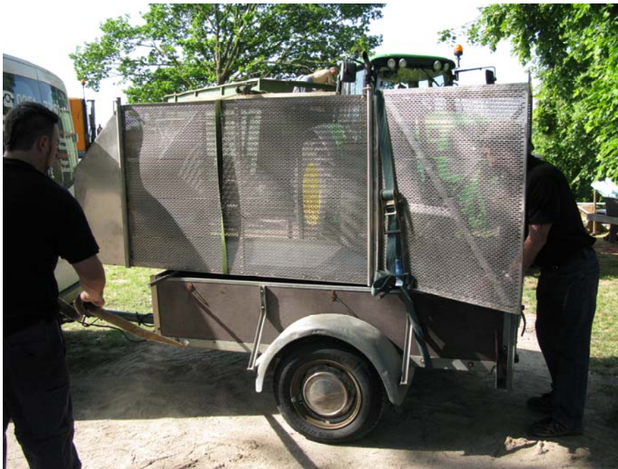
Die angelieferte Reuse