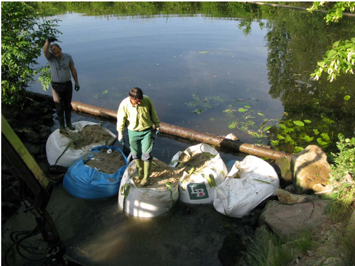
Der Fischtreppe-Einlauf wurde für die Baumassnahme versperrt

Tatsächlich wurden gleich in den ersten Tagen, noch vor der perfekten Einstellung der Reuse Fische gefangen. Erfreulicherweise handelte es sich um recht kleine, wenig Sprintstarke Fische wie Barsche, Rotaugen, Gründlinge und Ukeleis. Dies bedeutet, dass auch relativ schwache Fische die Fischtreppe überwinden können und eben nicht nur Sprintstarke wie Döbel oder sogar Forellen. Außerdem fanden sich gleich Jung-Aale in den Zählungen, die sicherlich den direkt vorangegangenen Besatzmassnahmen der Emsanrainervereine entstammen. Die Zählung soll über ein Jahr fortgeführt werden. Freiwillige Vereinsmitglieder, die sich an der Zählaktion beteiligen wollen, melden sich bitte bei unserem Gewässerwart Olaf Niepagenkemper unter 0251-48271-17