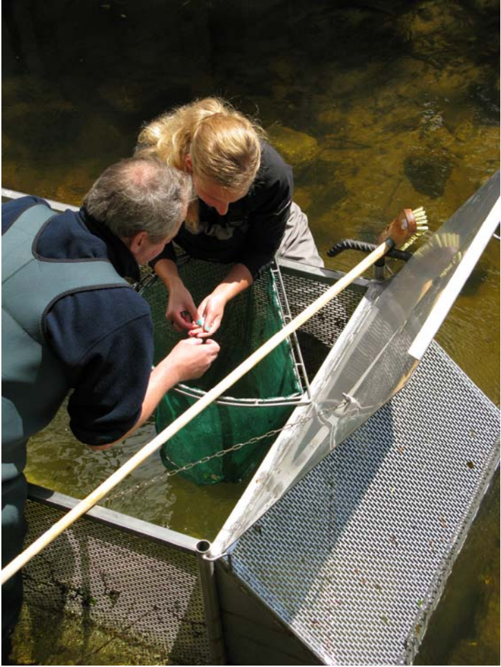
Die ersten Fänge