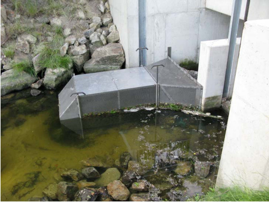
Nach dem Einbau